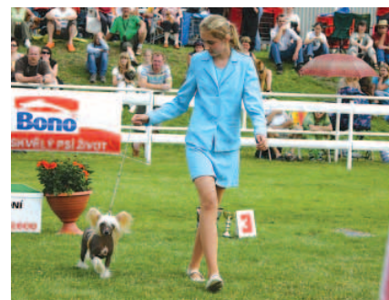
■ Návrat k rozhodčímu v obráceném T, malé plemeno je správně vedeno v pravé ruce a v linii pohledu rozhodčího.

Dřív než začnete figuru, zkontrolujte zrakem prostor kruhu a udělejte si představu o tom, jak asi bude její provedení vypadat. Měli byste mít zhruba jasno, kde provedete čtvrtobraty a kam bude směřovat vaše dráha z bodu C do D tak, aby byla kolmá k pohledu rozhodčího. Nezapomeňte, že pes má jít přesně v linii pohledu rozhodčího, zatímco vy se pohybujete mírně vlevo či vpravo od ní. V první části směřujte rovně na druhou stranu kruhu od rozhodčího. První čtvrtobrat provedte zřetelně, ale citlivě a bez přerušování, vodítko při něm zůstává v levé ruce, vy obcházíte psa zrychleným krokem. Hlídejte si následující rovnou linii, abyste se včas připravili na první vnitřní obrat. I když je figura složitá na přemýšlení, nezapomeňte na přicházející změnu upozornit hlasem také psa. Správně použité upoutání pozornosti vám obrat usnadní. Jistě víte, že vnitřní obrat má v sobě skryté časování na tři doby. Nárok do obratu, přendání vodítka se současným obratem a vykročení do nového směru. Můžete si v duchu plynule počítat – jedna – dvě – tři. V paměti byste