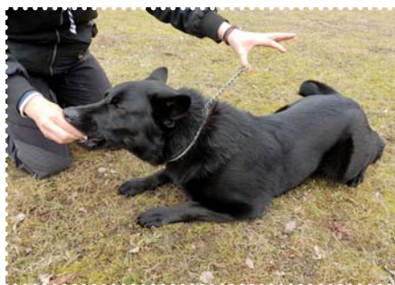
Stejně tak pokud se budete psa snažit odtáhnout třeba pomocí obojku – o to více se pes bude chtít dostat k ruce.

v ní mějte schovaný. Pes bude možná chvíli škrábat, štěkat a štouchat do vás, obzvláště pokud ho hodně motivuje jídlo, ale nakonec se přestane snažit k pamlsku dostat, i když třeba jen na zlomek sekundy. Jakmile nechá vaši ruku na pokoji, pochvalte ho a pamlsek mu dejte. Tak se naučí, že když bude způsobilý a trpělivý, tak mu s radostí dáte to, co chce. Když psi tuto hru pochopí, přestanou někteří na ruku dorážet, jiní naváží oční kontakt a pár jich dokonce před rukou ustoupí. Ať váš pes dělá cokoliv, tak pokud se nesnaží dostat k pamlsku a nechá vaši ruku na pokoji, vyslouží si pamlsek. Během tohoto cvičení nic neříkejte. Pokud psovi řeknete „nech“ nebo „ne“, pokaždé když se bude snažit dostat k pamlsku, tak vlastně sami přejímáte odpovědnost za jeho sebeovládání. Ale pokud ho necháte, aby experimentoval a sám přišel na to, že pamlsek získá, když nechá vaši ruku na pokoji, tak se časem začne chovat zdvořile z vlastní vůle.