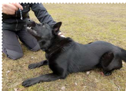
Velmi důležité je, abyste s rukou neucukávali. Takový náhlý pohyb by ho naopak ještě povzbudil, aby po ruce chňapl.