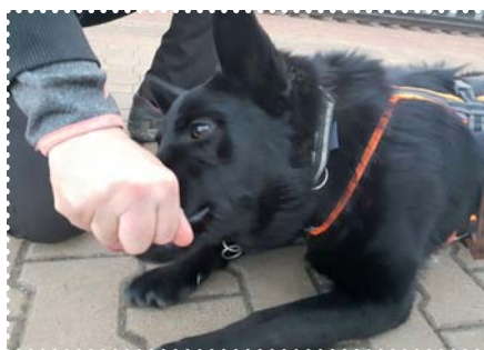
Ron se snaží dostat pamlsek z ruky, ale psův klidně čeká a neodtahuje ruku, dokud Rony nepřestane dorážet, a pak mu pamlsek dá.

Nechte ho, ať se podívá na pamlsek, ale nenechte ho, aby si ho vzal. Pokud se natáhne směrem k pamlsku (a to ze začátku pravděpodobně udělá), zavřete pamlsek do pěsti a počkejte, až pes vaši ruku nechá na pokoji. Nic neříkejte. Jen pamlsek zavřete do pěsti a čkejte, dokud pes nepřestane dorážet na vaši ruku. Velmi důležité je, abyste s rukou neucukávali. Takový náhlý pohyb by ho naopak ještě povzbudil, aby po ruce chňapl nebo aby na vás vyskočil. Držte ruku nehybně a pamlsek