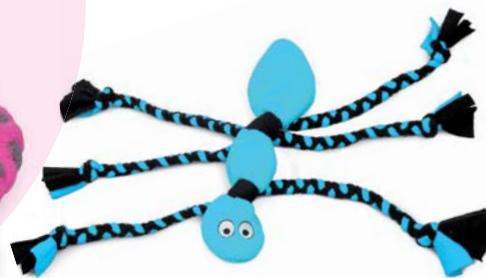
Náš milovaný mravenec - tři páry nohou a až 3 pískátka v tělíčku!