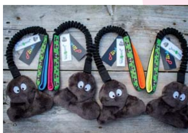
Hovínko na amortizéru prý bude HIT letošních Vánoc!